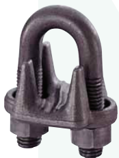
Self Color (JIS Standard F Type)