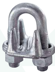
HOT DIPPED GALV. JIS B2809-1996